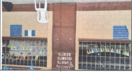
FOTO 10 : Fabricación e instalación de puertas de metal en módulos