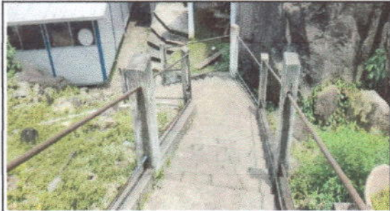
FOTO 13: Sustrucción de barandas de metal. Por tubo hg galvanizado