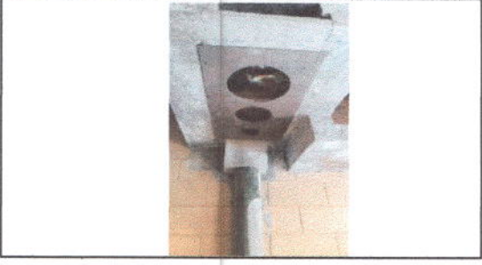
FOTO 12: Sustitución de plancha de metal de 3 homillas Y Sustitución de chimenea de concreto por tubo de metal