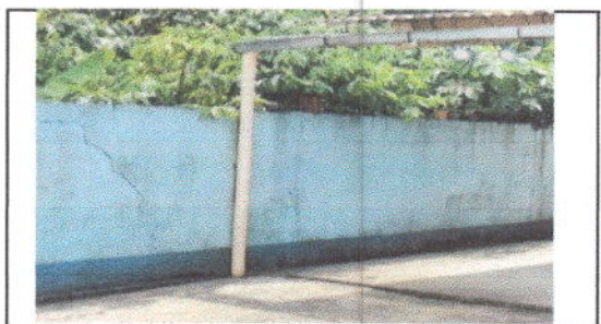
FOTO 6: Sustitución de bajada de agua pluvial de metal por tubo PVC 3"

Observación: Si es necesario se pueden agregar hojas adicionales y actualizar el registro en las hojas.